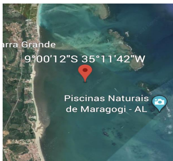
Coordenadas da Raia